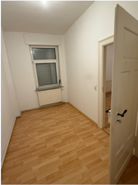
Schlafzimmer mit Zugang zum Wohnzimmer