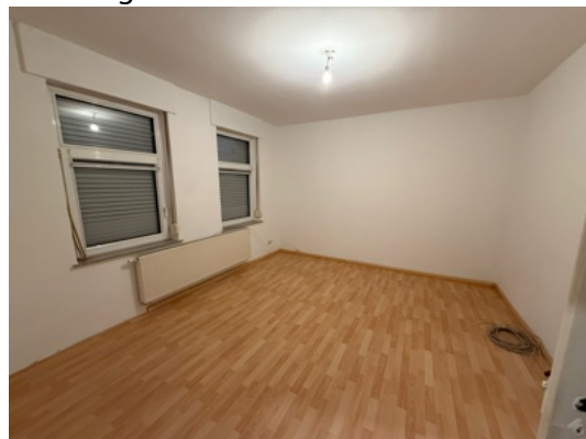
Wohnzimmer Fenster mit Außenrollos