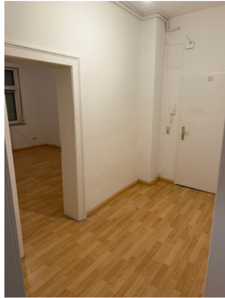
Flur mit Wohnungstür und Zugang zum Wohnzimmer