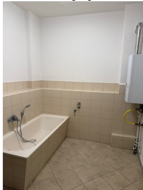
Tageslichtbad mit Gastherme