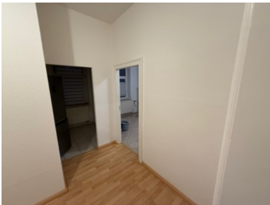
Flur mit Zugang zur Küche (links) und Bad (rechts)