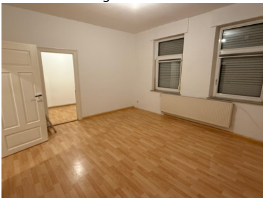
Wohnzimmer mit Zugang zum Schlafzimmer