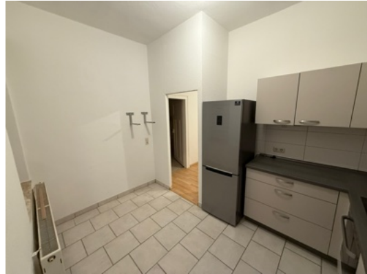
Küche – Eingangsbereich