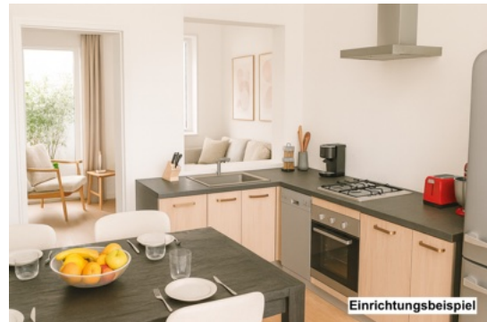
Küche – Einrichtungsbeispiel