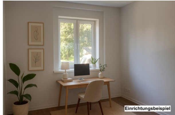
Zimmer 2 – Einrichtungsbeispiel