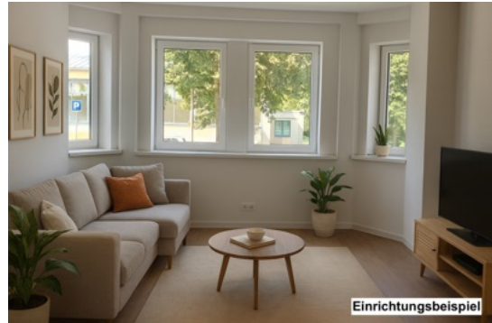
Wohnzimmer – Einrichtungsbeispiel